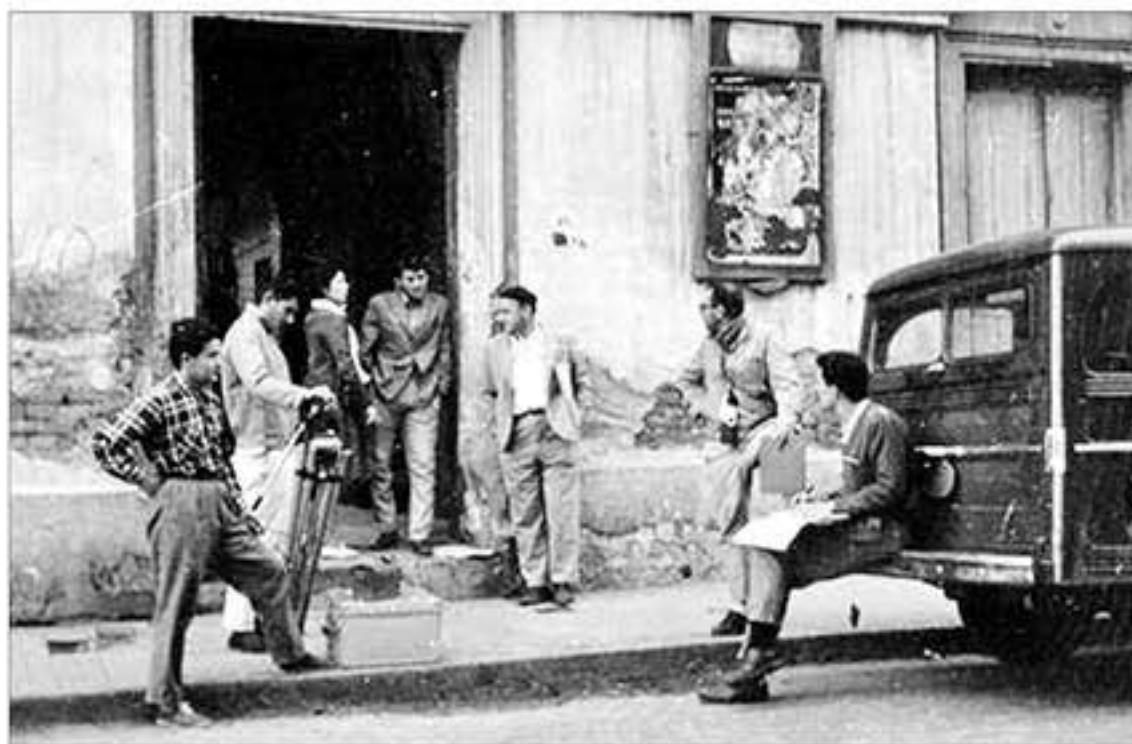
A medio siglo del estreno y prohibición del "doc-fic" "Los cuarenta cuartos", habrá una exposición a cargo de Carlos Gramaglia, egresado del viejo Instituto de la UNL y productor ejecutivo del filme.

-"Zamora, tierra y hombres libres" (Venezuela), dirigida por uno de los grandes e históricos realizadores del cine venezolano: Román Chalbaud, obra que se ubica a mediados del siglo XIX, reflejando las desigualdades en que la sociedad colonial mantenía a campesinos y esclavos, y la irrupción de Ezequiel Zamora movido por profundos ideales de libertad, cuestionando tantas desigualdades sociales, y proponiendo una distribución equitativa de las tierras (mañana a las 21,