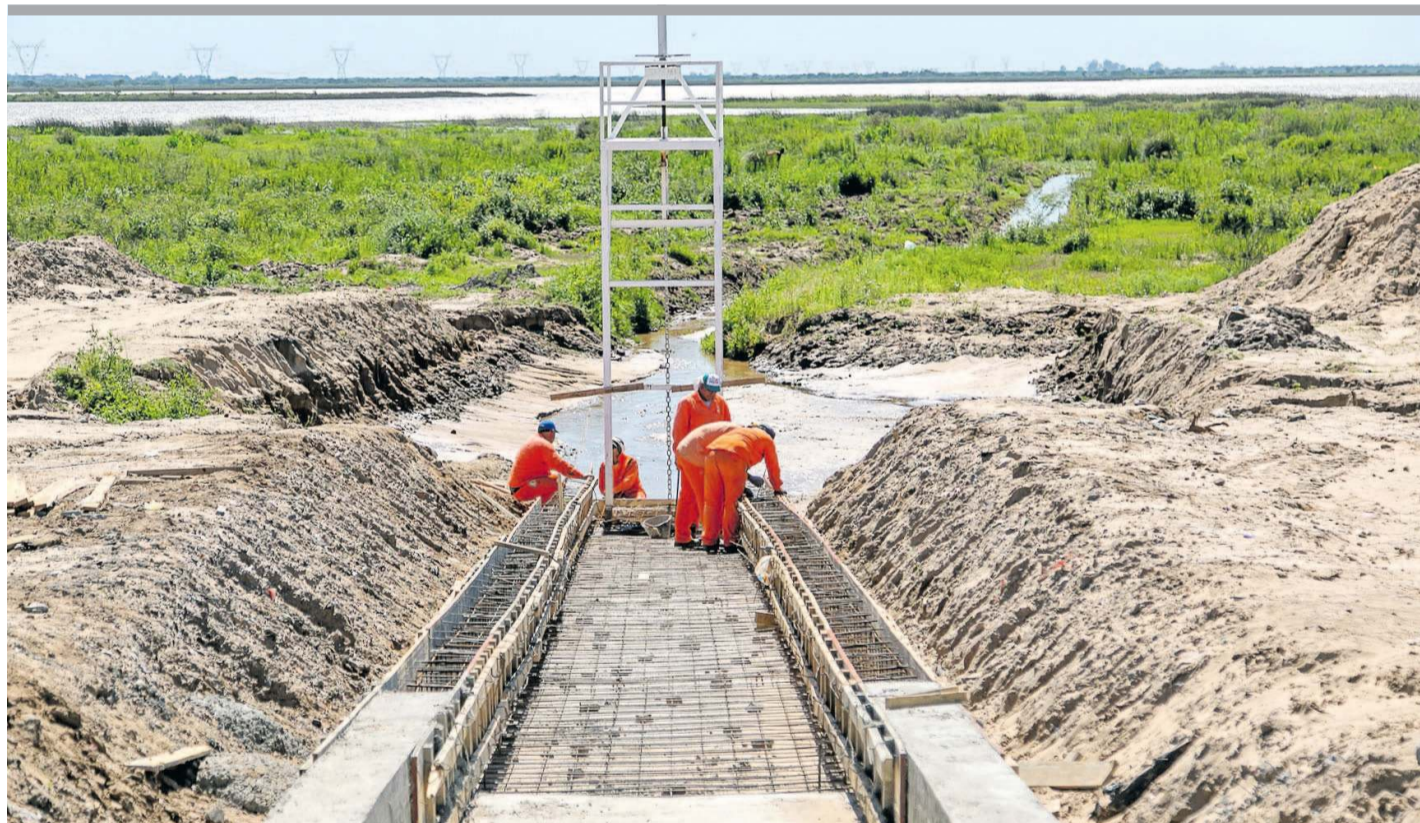
P. 13 / ÁREA METROPOLITANA / PAVIMENTO, DESAGÜES Y VECINAL REMODELADA ALTO VERDE SUMA OBRAS CLAVE

● La agenda para esta semana incluye el proyecto de “ley anti-barrabravas”, el financiamiento de partidos políticos y la Ley Micaela, de capacitación en temática de género en los tres poderes del Estado. Las sesiones arrancarán mañana, en medio de arduas negociaciones en búsqueda de consenso. P. 2